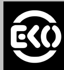
Biosiegel Niederlande Skal-Verband