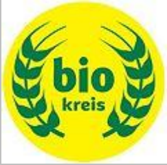
Anbauverband Biokreis e.V.

••••• Nennt die Biosiegel, die ihr kennengelernt habt: